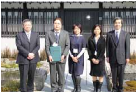
特定非営利活動法人 国際教育文化交流会様