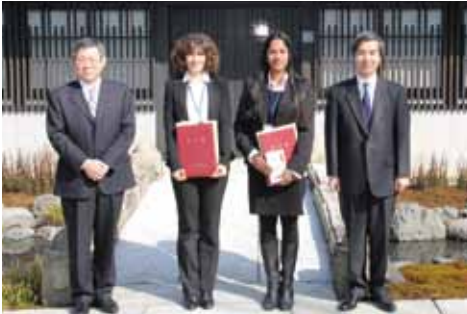
助成金交付対象者の皆様

また、国際交流功労賞は、社会に有用な活動や事業を通じて、国際交流活動に貢献し、その功績が顕著で、地域社会の模範となる、静岡県との関わりを持つ個人、法人、団体を対象に贈られるものです。